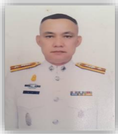
พ.ต.ท. อรรถพล สิงหปรุงากร